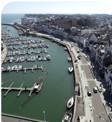
Le Port du Pouliguen / La Baule

Au Pouliguen, cet engagement est visible toute l'année !